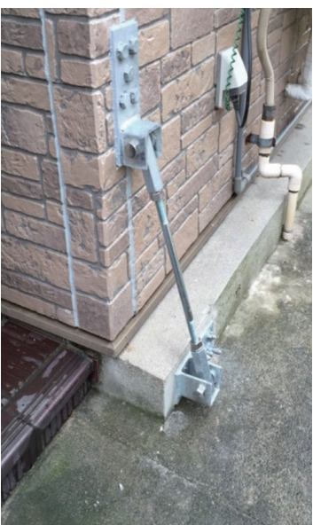
上) 補強金具 下) 外側から耐震補強します。

いただいたご寄付は当基金の助成事業で、主に特定枠(神戸で得たノウハウやネットワークで、大規模災害被災地を支援する活動)への助成金として活用してきました。