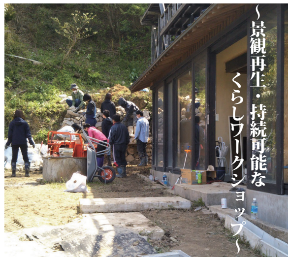
景観再生・持続可能なくらしワークショップ

淡路島アートセンターでは、豪雨で崩れた裏山を「石積み」の手法を用いて修復することで、昔からの知恵と景観を生かそうという活動をしています。参加者の多くは若い人で、コロナ禍で直接人と出会わない生活に物足りなさを感じている大学生や、土と水の専門家もいます。徳島の石積みの学校から招いた講師に教えてもらいながら、まずのり面に小石を並べ、次に大きな石を積み上げていきます。ハンマーで石を割ったり抱えて運んだりと地味な力仕事ですが、みなさんの息が合い笑い声や冗談が飛び出して楽しそうです。