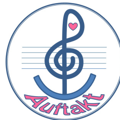
NPO 法人アウフタクト

ア) プレゼンを初体験させていただき、今後もこのような機会があれば参加させていただければと思います。