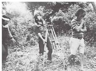
『風の島』撮影中の大重監督