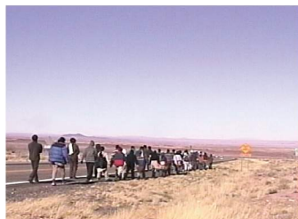
映画『ビッグマウンテンへの道』より