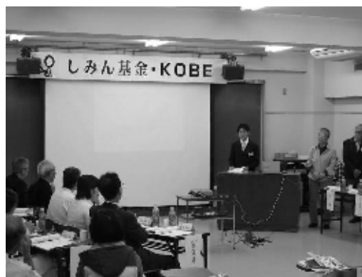
公開審査会の様子

今年度の助成事業は7月中旬に応募要項を公表し、7月21日～8月31日の期間に申請受付を行いました。応募期間中に事前個別相談会(予約制)を実施してのべ27団体の皆さんにご利用頂きました。最終的に応募総数は、70件