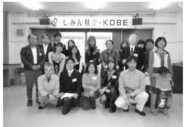
助成先団体の皆さん