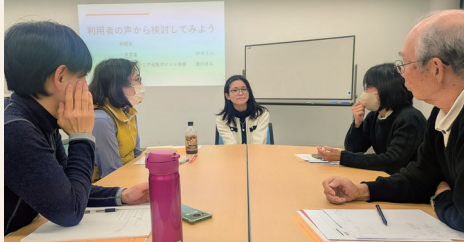
ぼらくる利用者との意見交換も実施。

シニアがボランティアをしたらポイントを貯められ換金できる「KOBESシニア元気ポイント」はこれまででは高齢者施設等での活動がメインでしたが、一部の地域活動も対象となり当基金で活用促進を担当している神戸市ボランティアアママッチングサイト「ぼらくる」からの申込となりました。 それに伴い、神戸市からの受託事業として地縁団体や市民活動団体を対象に、サイトや制度の説明とより良い募集記事作成のための講座を1・2月に須磨区、北区、中央区で実施しました。