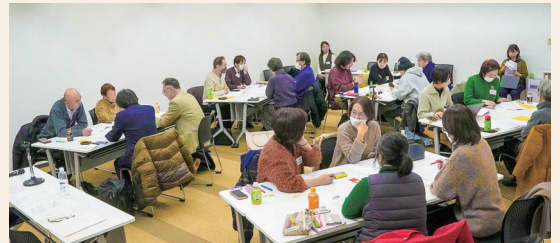
皆さん熱心に学ばれていました。

市民活動団体が日常の活動の中で、災害時に思いを致したとき生まれてくる災害時支援のアイデアを募集しました。